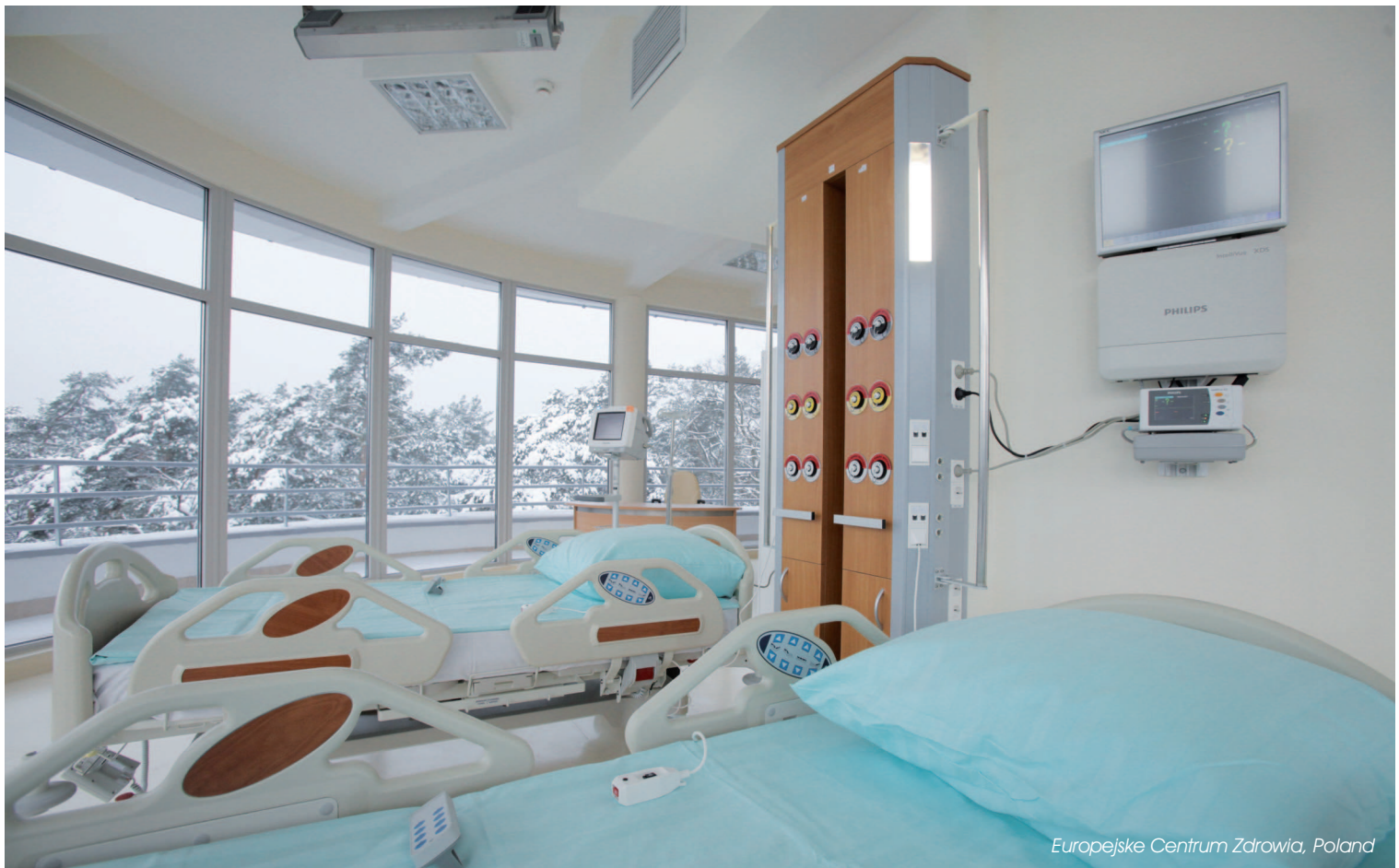
Europejske Centrum Zdrowia, Poland