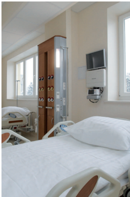
ALGUNAS REFERENCIAS / SOME REFERENCES: Hospital Oncológico de San Sebastián. Europejske Centrum Zdrowia, Poland. Al Khaleej Specialized Hospital, U.A.E.