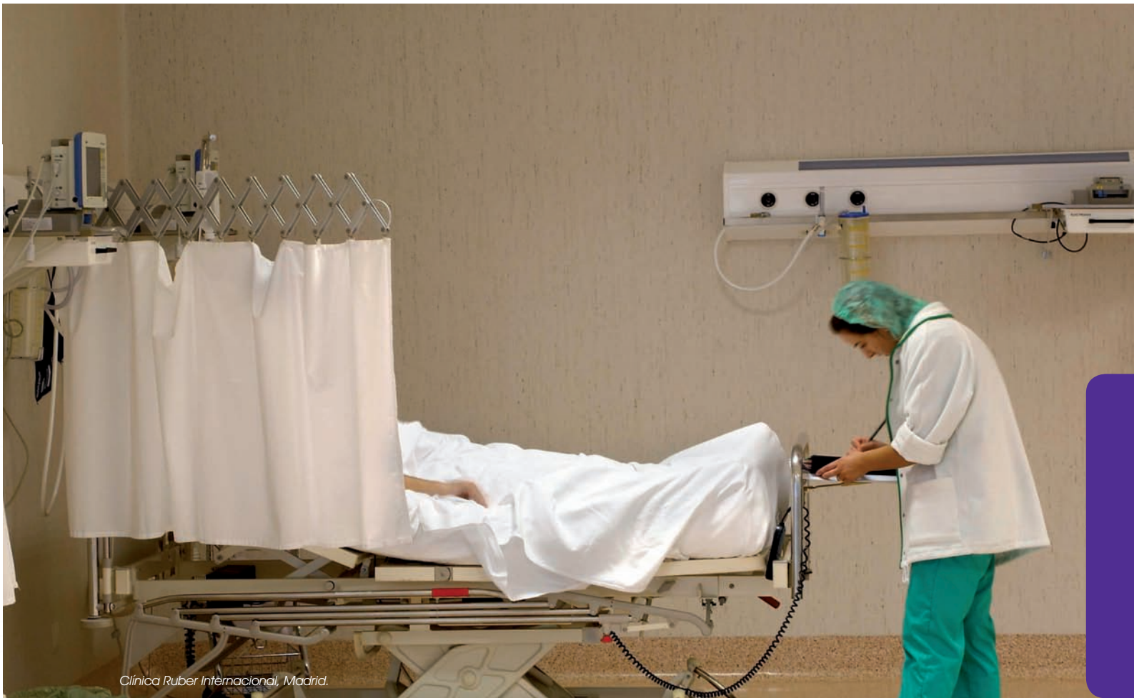
Clinica Ruber Internacional, Madrid.