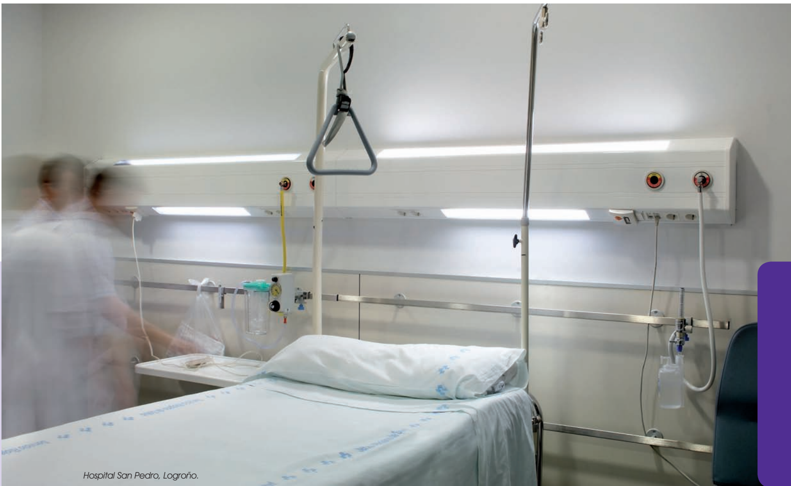
Hospital San Pedro, Logroño.

Un perfil de aluminio dividido en tres compartimentos, para iluminación de lectura y mecanismos, gases medicinales e iluminación indirecta.